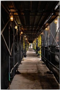
Abbildung 1: Gerüst

Im Jahr 2022 lag die Rohstahlproduktion Deutschlands bei 36,8 Millionen Tonnen 1 . Damit liegt Deutschland auf Platz 8 der größten Rohstahlhersteller weltweit.