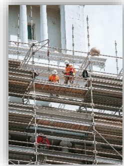
Abbildung 2: Gerüst an Fassade

Tipp: Schaue dir die Gerüstbauteile und den Aufbau eines Gerüsts in deiner Nähe einmal genauer an.