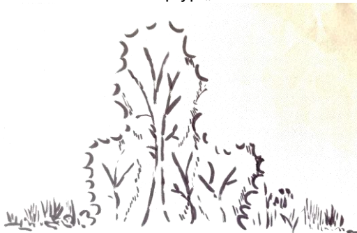
Skizze für den Biotoptyp „Hecke“