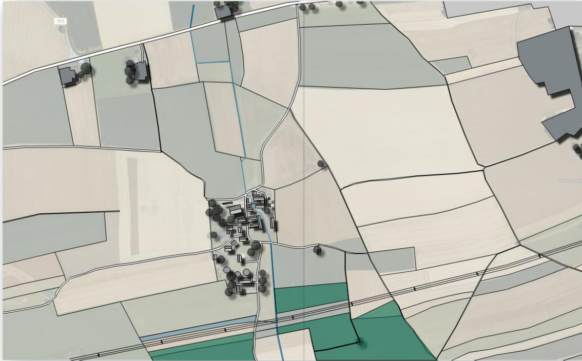
Abbildung 1: Skizze Dorf