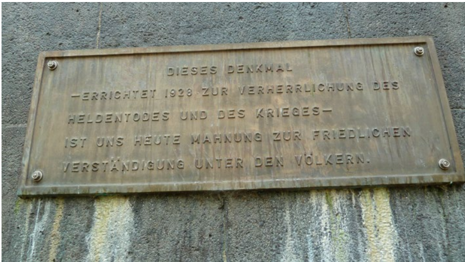
Eine nachträglich angebrachte Plakette ordnet das Denkmal in seinen zeitgeschichtlichen Zusammenhang ein.