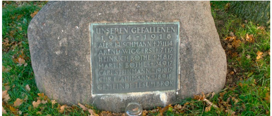
Kriegerdenkmal Lesumbrock.

Kriegerdenkmäler sind errichtet worden, um den jeweiligen Betrachtenden eine Botschaft über den Krieg und die Bedeutung des Kriegstodes zu vermitteln. Um diese zu verstehen, müssen wir das Denkmal in den Einzelheiten seiner Gestaltung hinsichtlich der Inschriften und der verwandten Symbole sowie die Wahl seines Standortes deuten und in seiner Gesamtheit interpretieren. Gehe dazu wie folgt vor: