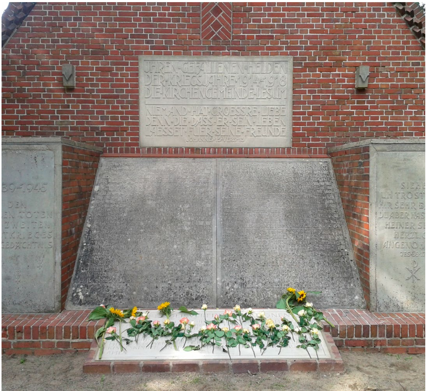
Kriegerdenkmal auf dem Friedhof Lesum in Bremen.