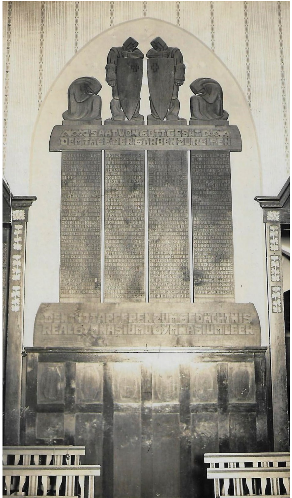
Die Gedenktafel des Ubbo-Emmius-Gymnasiums an ihrem ursprünglichen Platz im Eingangsbereich des Gymnasiums.

Text basierend auf Informationen von Astrid Köhler, UEG.