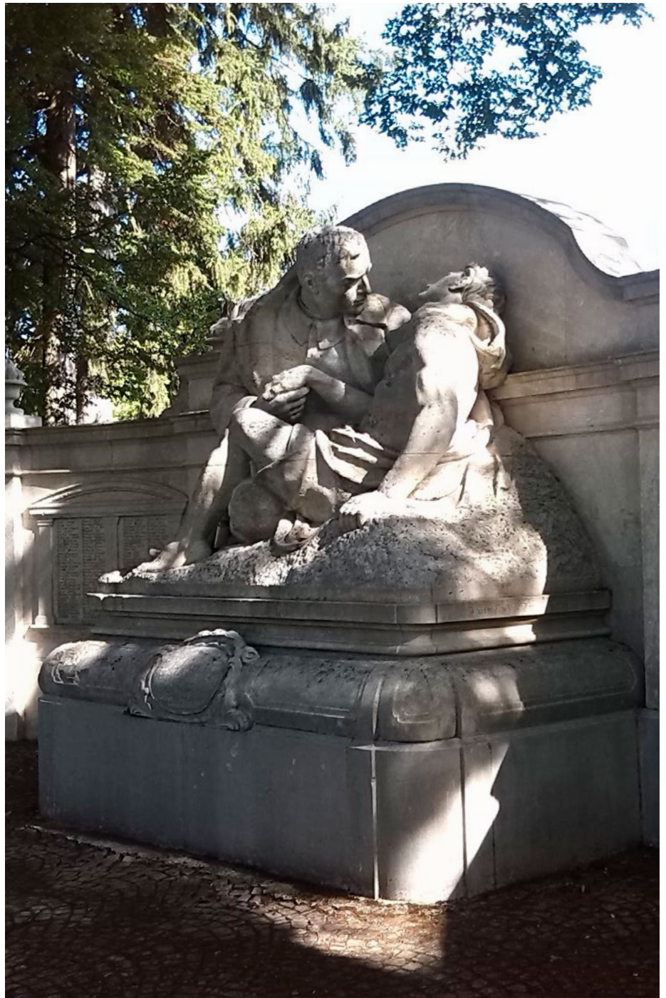
Kriegerdenkmal auf dem Friedhof Bruchsal.

Die Kerncurricula aller Bundesländer räumen der Geschichts- und Erinnerungskultur einen prominenten Platz ein. Darum ist das hier vorgestellte Material im ganzen Bundesgebiet im Unterricht der verschiedenen Schulformen gleichermaßen einsetzbar.