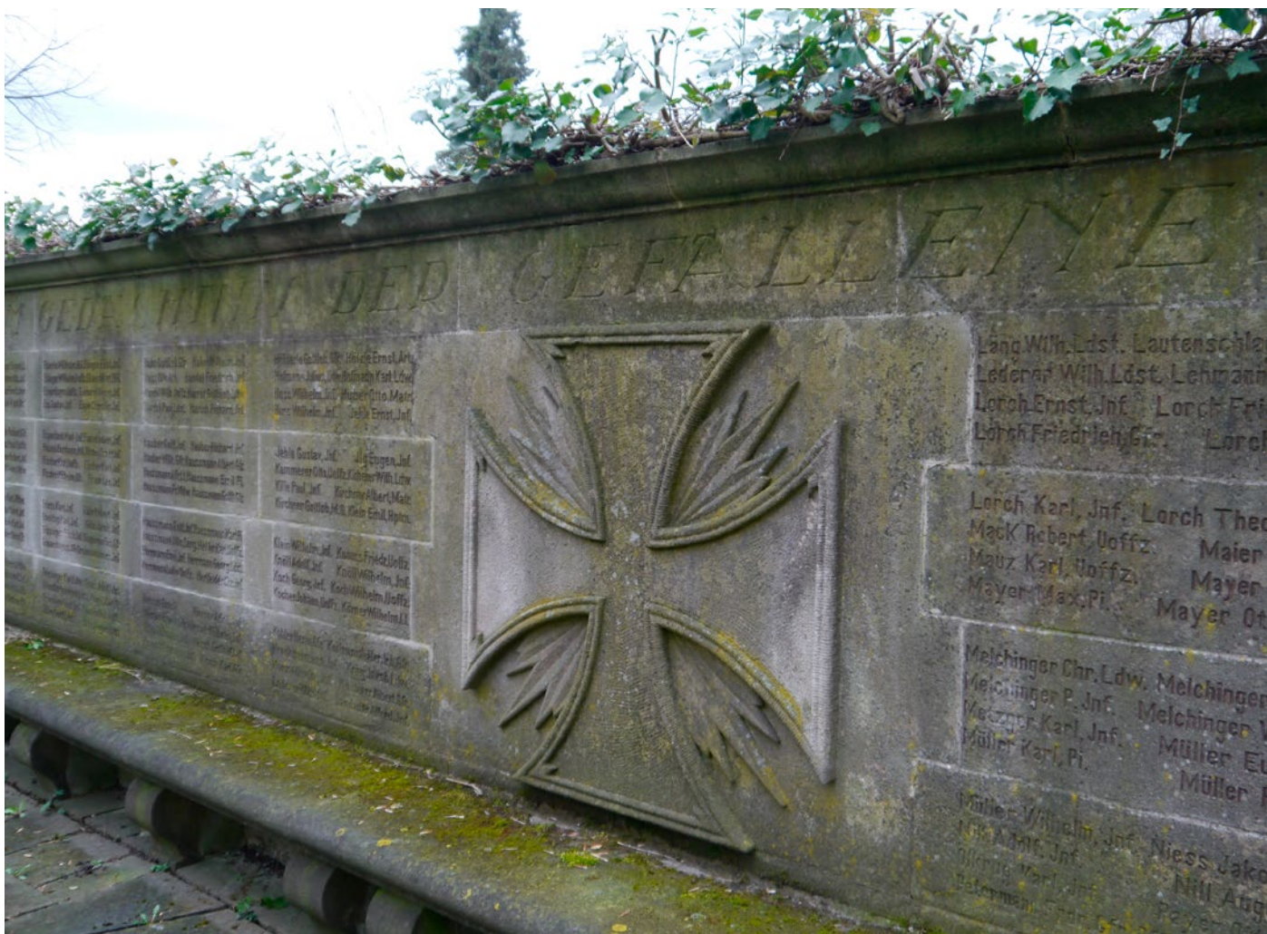
Kriegerdenkmal auf dem Alten Friedhof Nürtingen.

an den Verlust bzw. den gewaltsamen Tod der Soldaten.