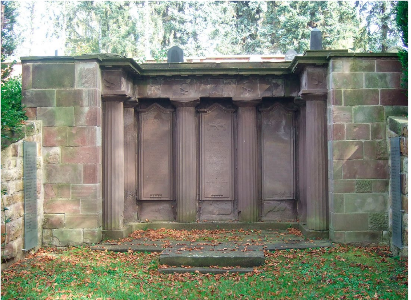
Ehrenmäler für im Ersten Weltkrieg gefallene Soldaten sollten an die Toten erinnern, dienten häufig aber auch dazu, sinnstiftende Botschaften auszudrücken. Das Foto zeigt ein 1920 errichtetes Ehrenmal auf dem jüdischen Friedhof Kassel.