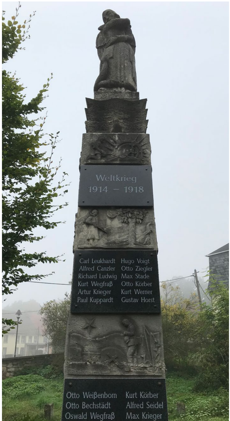
Kriegerdenkmal in Bachra/ Thüringen

Das Kriegerdenkmal in Bachra wurde zu den unterschiedlichen Zeiten immer wieder ergänzt.