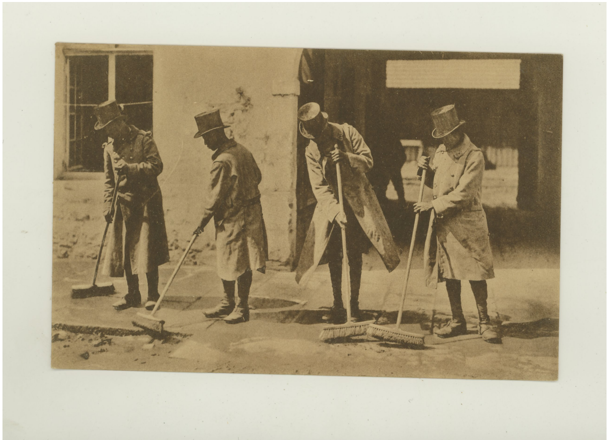
Französische Soldaten aus dem Senegal in deutscher Kriegsgefangenschaft, Charleville – Flandern