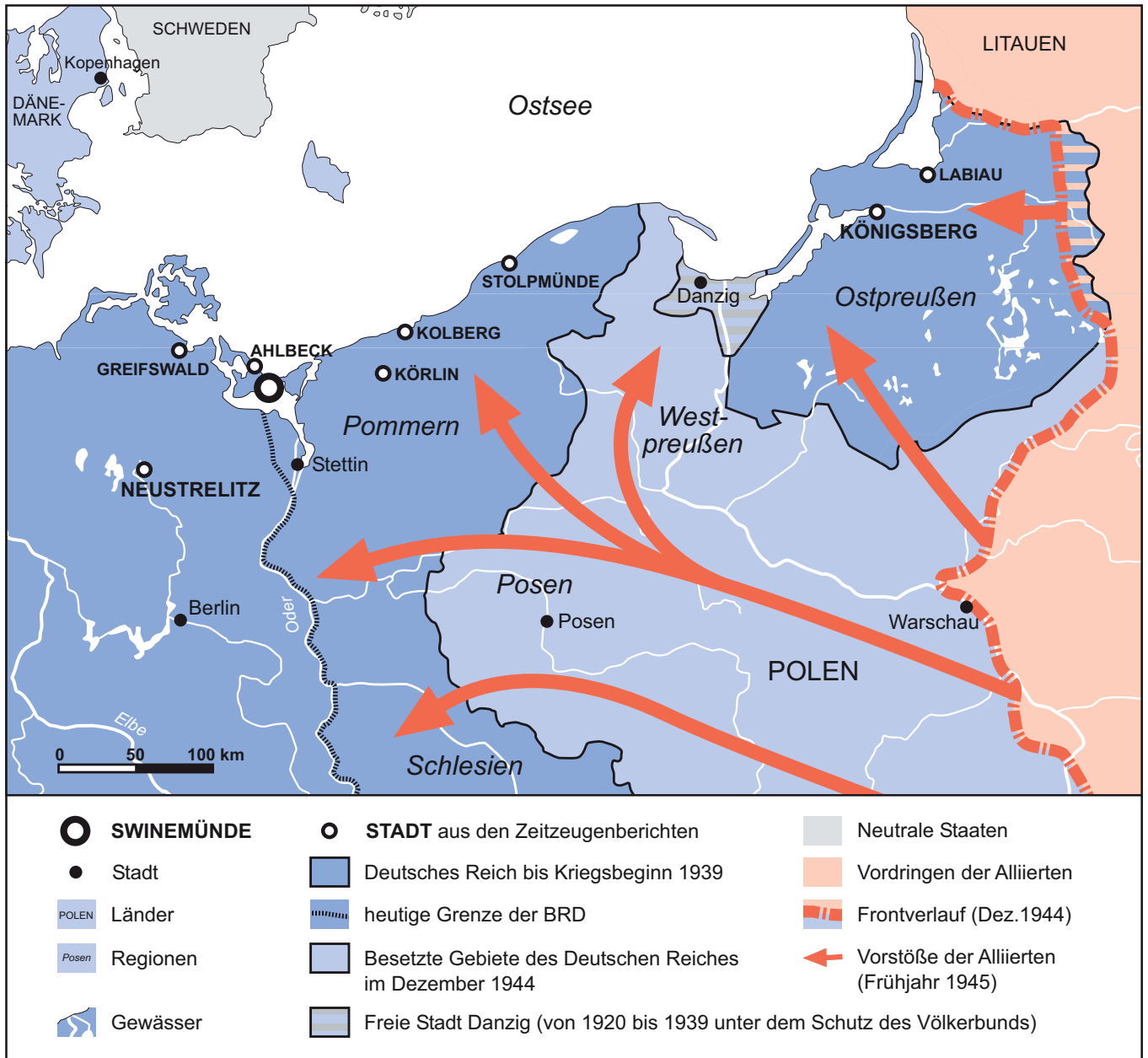
Karte der Regionen und Orte aus den Zeitzeugenberichten des Spiels Swinemünde (Daniel Giere 2017).