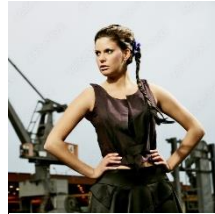
Abbildung 3