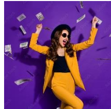
Abbildung 2