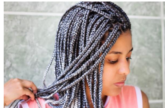
Abbildung 6: Junge Frau mit Braids

94,8 % der Friseur- und Kosmetiksalons sind kleine Unternehmen mit weniger als zehn Mitarbeitern. Gleichzeitig erwirtschaften sie aber 76,3 % des Branchenumsatzes. (Quelle: https://www.ibisworld.com/de/branchenreporte/friseur-kosmetiksalons/406/ )