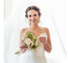
Abbildung 5