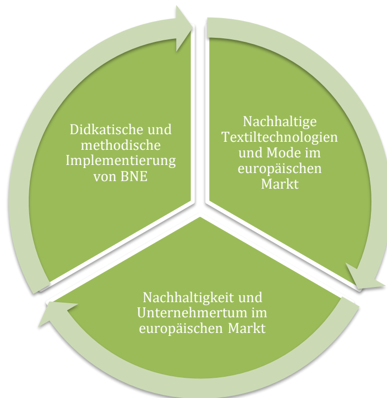
Abb. 1.: Struktur des BNE-Moduls, CC BY-SA-NC Grundmeier

Die Struktur des BNE-Moduls wird in der folgenden Grafik verdeutlicht: