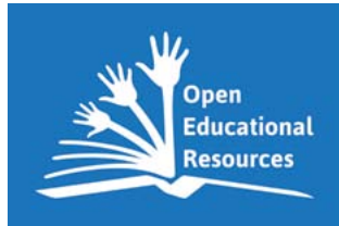
„Global OER Logo“ 1 von Jonathas Mello unter CC BY 3.0 2

Nach der Definition von UNESCO versteht man darunter: