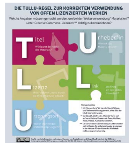
Grafik von Julia Eggstein nach einem Konzept von Sonja Borski und Jöran Muuß-Merholz für OERinfo – Informationsstelle OER 6 unter CC BY 4.0-Lizenz 7

Die CC-Lizenzen müssen immer genau angegeben werden. Hier hilft die TULLU-Regel: