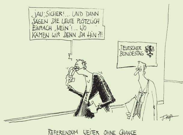
Zeichnung: Thomas Pfaffmann

Quelle: http://www.vermdl-sachsen.de/vortraege/patzelt.html Aus: Die Zeit Nr.9, 22.02.2001, S. 9. Prof. Patzelt lehrt Politikwissenschaften an der TU Dresden