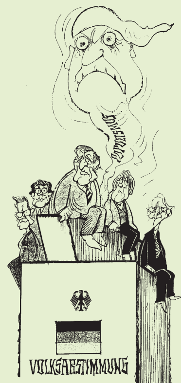
Zeichnung: Walter Hanel/Rheinischer Merkur vom August 2004.