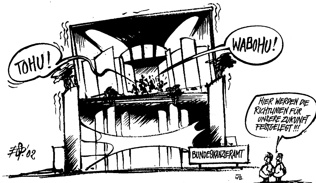
Karikatur: Klaus Espermüller