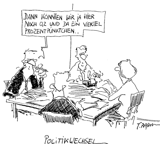
Karikatur: Thomas Plabmann

Mit der Karikatur kann noch einmal bildhaft die zentrale Herausforderung an Koalitionsverhandlungen verdeutlicht werden: Sich aus den verschiedenen Interessen, Ideen, Vorgehensweisen, Lösungsvorschlägen auf eine Linie (=Koalitionsvertrag) zu einigen.